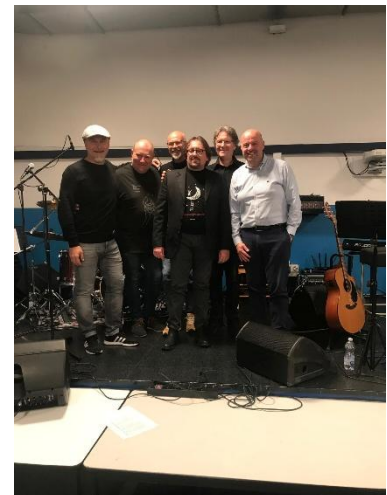
Tour MISTRAL FOR AIL