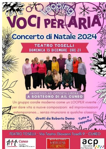
Concerto di Natale