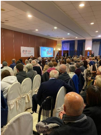
Festa del Volontario