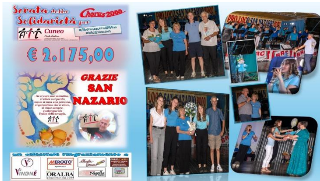
Concerto del Cuore