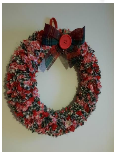
GHIRLANDA- Offerta 20,00€