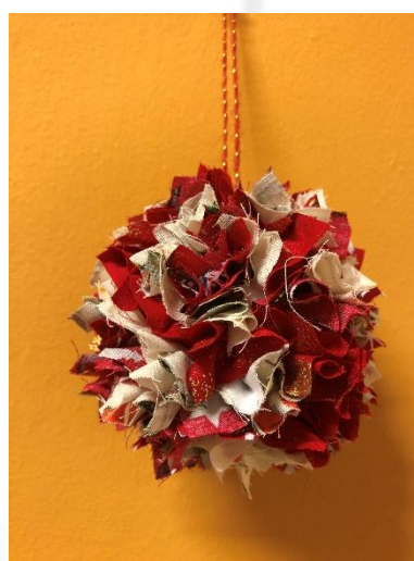
PALLINA DI NATALE - Offerta 5,00€