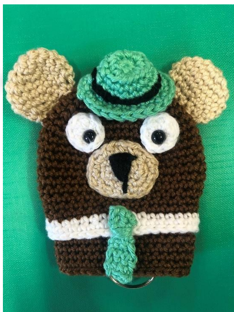
PORTACHIAVI- Offerta 10,00€