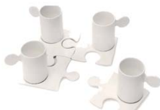
TAZZINA PUZZLE - Tazzina da caffè in porcellana bianca. Capacità 12 ml. OFFERTA: € 15 cad.

OGGETTI NATALIZI: sono disponibili alcuni oggetti regalo, forniti con imballo in cartone, adesivo AIL e certificato di garanzia.