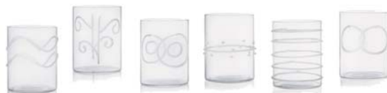
SET BICCHIERI "DECO BIANCO" - Set di 6 bicchieri in vetro con decoro bianco a rilievo. Ø 7 cm. h 9 cm. OFFERTA: € 27