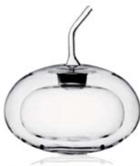
OLIERA - Oliera a 2 pareti in vetro trasparente. h 12 cm. OFFERTA: € 15