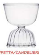
COPPETTA/CANDELIERE - Coppetta in vetro trasparente, utilizzabile anche come portacandela. h 14 cm. OFFERTA: € 15