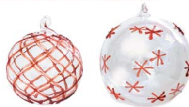
DECORAZIONI NATALIZIE - Raffinate sfere natalizie in vetro lavorato a mano.